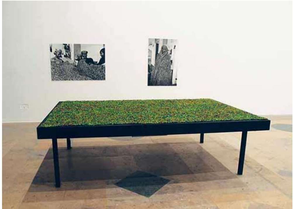
Figure 2. Marie Preston, Sur le seuil du divers , 2006. Photographies noir et blanc, tirage baryté. Table et couverture tricotée en wax, son 4.0. 180 x 280 x 80 cm © Marie Preston.