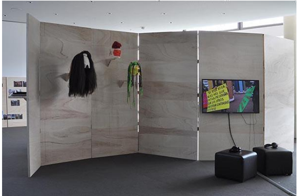
Figure 8. Vue d'ensemble de l'exposition « Commérages » conçue et réalisée par Marie Preston avec Stéphanie Airaud, Françoise Alexandre, Arminda Alves, Aïcha Akremi, Carine Fariba, Alejandra Montalvo et Nelly Zeitlin © Marie Preston.

que, nous-mêmes, étions en train de constituer une sorte d'espace public, lieu de débats. Le processus de création est relativement semblable à celui dans le Morvan. Après avoir écouté les récits, nous avons réfléchi à des formes permettant de les faire exister autrement que par le discours. Nous avons eu la volonté de créer des personnages transversaux (Figure 8).