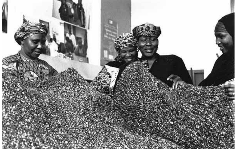
Figure 1. Marie Preston, Sur le seuil du divers , 2006 (détail), photographies noir et blanc, tirage baryté, 86,5 x 127,5 cm © Marie Preston.

de mener une activité qui ne soit pas calquée sur celle qui avait lieu dans le local, de provoquer une étrangeté. Plusieurs œuvres ont été créées pendant ces trois ans durant lesquels j'étudiais encore à l'école des beaux-arts à Paris (Figure 1). J'étais dans une économie de travail confortable et je pouvais y aller très souvent.