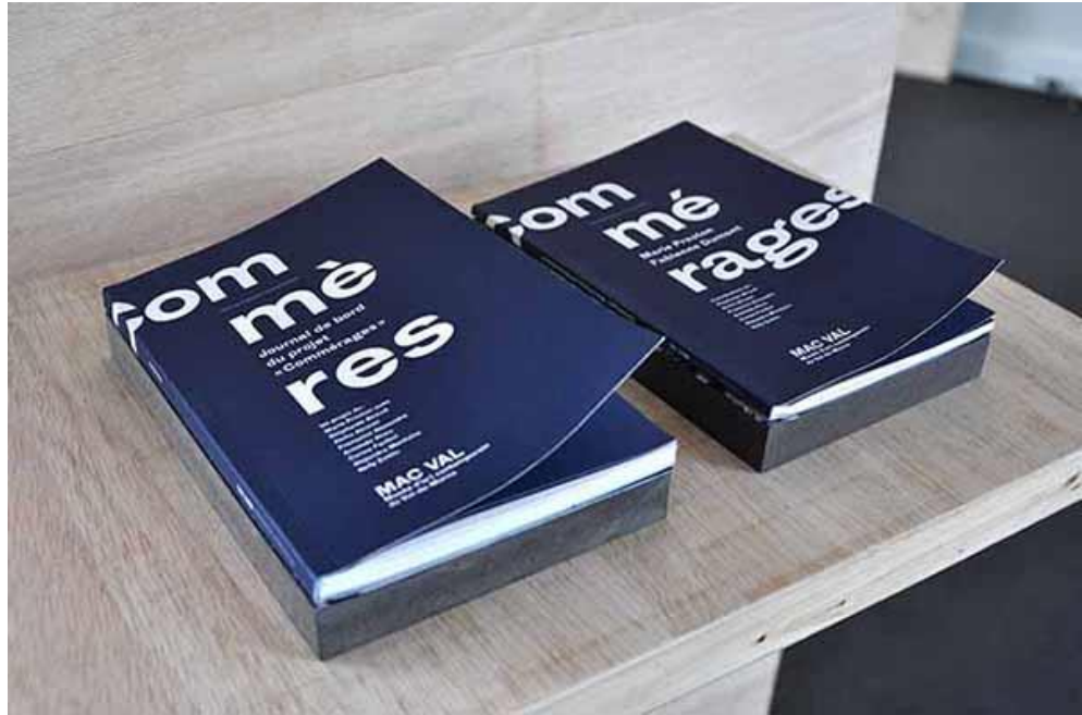
Figure 9. Double édition publiée à l'occasion de l'exposition « Commères » et « Commérages », éd. MAC VAL, coll. Chroniques muséales, 2015 © Marie Preston.