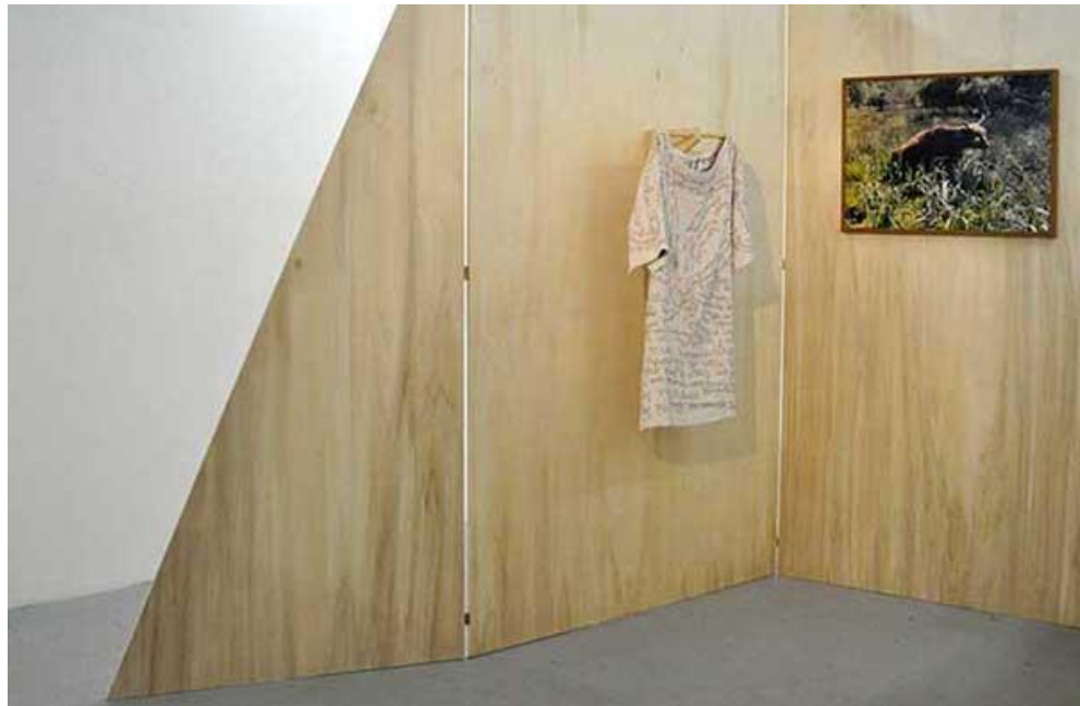
Figure 5. Nout Patouais (Point de marque) , réalisé par Marie Preston à partir des paroles d'une chanson écrite pour le projet par Régine Perruchot. Drap de chanvre, fils à broder, 815,50 x 140 cm, 2012 ; Marie Preston, Highland Cattle, Dun-les-Places, 28 juin 2012 . Photographie argentique, 74 x 54 cm, 2012. Vues de l'exposition « Le Pommier et le Douglas », Treize, Paris © Marie Preston.

photographies, une pièce tricotée en angora, une robe brodée également activée lors d'une performance et un texte qui prend la forme d'un conte ainsi qu'une carte postale (Figure 5 et 6). Les modalités de coopération ont été à chaque fois spécifiques aux relations individuelles, aux savoir-faire des uns et des autres et à leur volonté. Ce qui est aussi intéressant, c'est que parfois, on se lance dans des collaborations et cela ne marche pas. Par exemple, j'ai rencontré un groupe de femmes turques qui ne parlaient pas du tout français. C'était très compliqué car on n'avait pas vraiment d'interprète : je ne les comprenais pas, elles ne me comprenaient pas. Je me suis dit que l'on pourrait communiquer par l'intermédiaire d'images. J'ai donc proposé un dispositif courant dans les ateliers proposés par des photographes, qui consiste à prêter des appareils pour réaliser des photos à partir desquelles on peut faire plein de choses car c'est un matériel souvent très intéressant. Je leur ai donc donné un appareil photo et quand nous avons découvert les images, elles ignoraient qui les avait faites. J'ai compris ensuite qu'en réalité c'était la personne monitrice de l'atelier qui avait pris les clichés pour me faire plaisir... Cependant, l'une des photos nous a plu car elle représentait la forêt morvandelle de manière un peu « fantastique » en adéquation avec un imaginaire très présent localement.