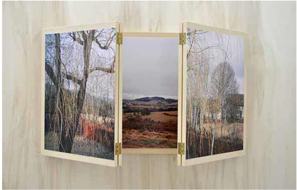
Figure 4. L'histoire de Just , réalisé par Marie Preston à partir de photographies de Monique Lucazeau et avec l'aide de Jean-Philippe Darini. Polyptyque photographique. Frêne et photographie argentine, 243 x 50 cm, 2012 © Marie Preston.